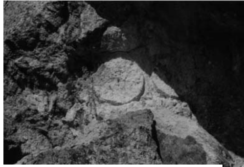
δ: Ημιλαξευμένη μυλόπετρα