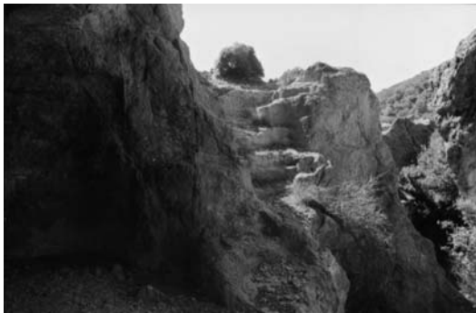
γ: Λαξευμένα σκαλοπάτια που οδηγούν σε υπόγεια αίθουσα