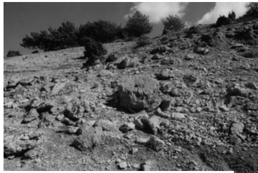
β: Μυλόπετρα σε μπάζα βόρειου μετώπου