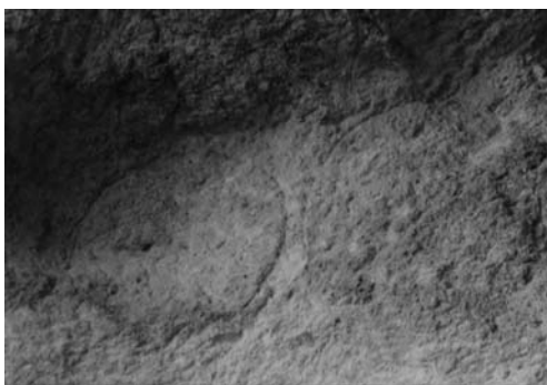
γ: Χαραγμένες μυλόπετρες