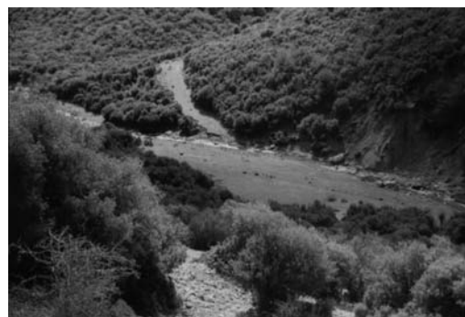
δ: Χώρος απόθεσης - φόρτωσης