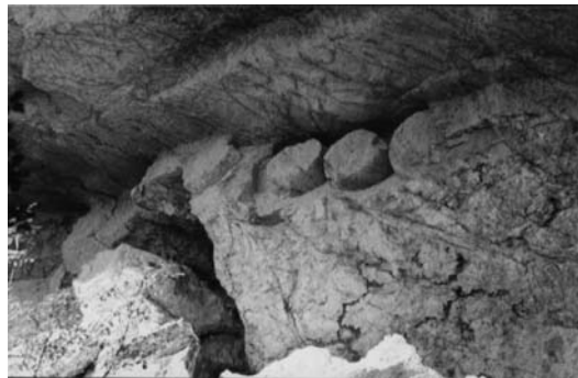
β: Ημιλαξευμένες μυλόπετρες