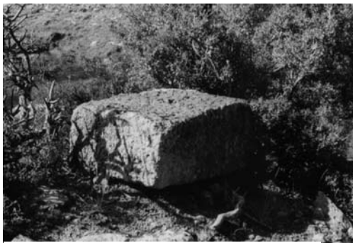
γ: Λαξευμένο αγκωνάρι – Παρυφές βόρειου μετώπου