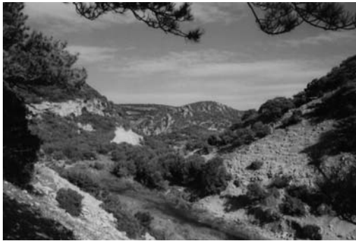
α: Τεράστιοι όγκοι μπάζων