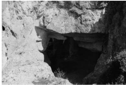
β: Υπόγεια αίθουσα