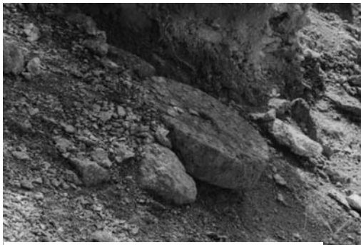
α: Μυλόπετρα σε μπάζα στη βόρεια όχθη του ρέματος

Ένα ερώτημα που μπαίνει είναι γιατί ο τότε "βιομήχανος" χρησιμοποίησε το συγκεκριμένο πέτρωμα για την κατασκευή μυλόπετρας και όχι τον ψαμμίτη ή άλλο πέτρωμα που ανταποκρινόταν καλύτερα στις "τεχνικές προδιαγραφές". Η απάντηση φαίνεται να είναι απλή : Στην ευρύτερη περιοχή δεν απαντούν ψαμμίτες σε ποιότητες και ποσότητες τέτοιες που να δικαιολογούν εγκατάσταση "λατομικής μονάδας". Απεναντίας το ηφαιστειακό λατυποπαγές βρίσκεται σε εκτεταμένους σχηματισμούς και οι "δοκιμές" έδειξαν ότι το υλικό αυτό κατέχει σε μεγάλο βαθμό τις αναγκαίες προδιαγραφές κι' έτσι, πιθανόν, να άρχισε η λειτουργία του λατομείου.