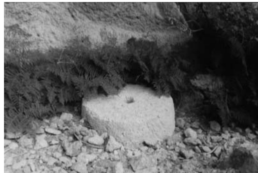
δ: Μυλόπετρα στη βόρεια κοίτη του ρέματος