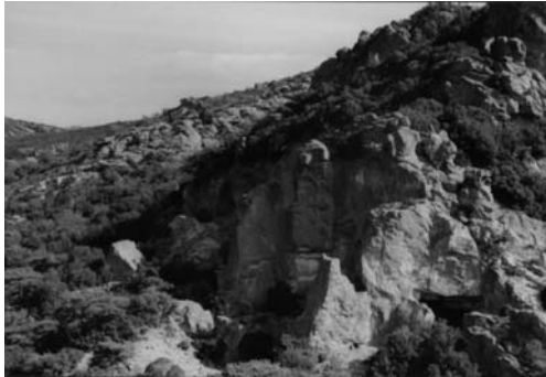
γ: Βόρειο τμήμα πυροκλαστικών σχηματισμών