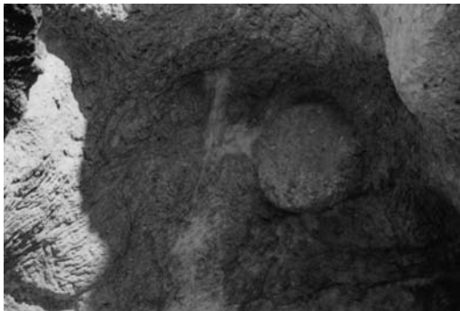
α: Ημιλαξευμένη μυλόπετρα