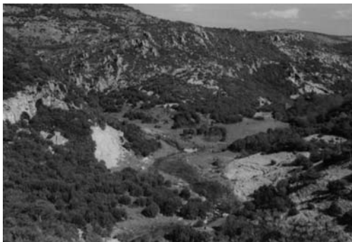
α: Πυροκλαστικοί σχηματισμοί – Ρέμα Γιαλού

Διάσπαρτες μολόπετρες υπάρχουν κοντά και μέσα στην κοίτη του χειμάρρου μισοθαμμένες από τα μπάζα και στα θαμνοσκεπασμένα δάπεδα (Σχ.4δ,Σχ.5α,β).