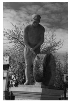
δ: Λιθοξόδος - Πλατεία Πετρωτών Έβρου