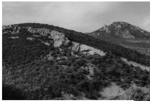
β: Νότιο τμήμα πυροκλαστικών σχηματισμών