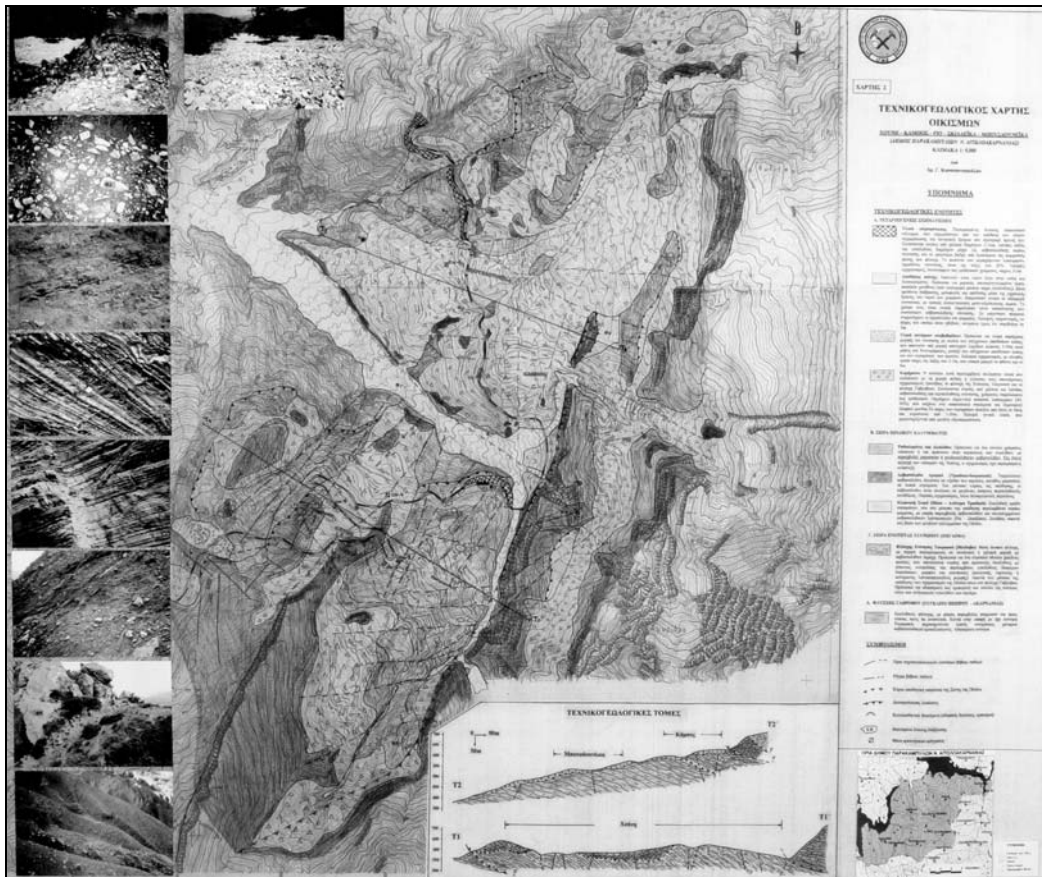
Σχήμα 3. Τεχνικογεωλογικός χάρτης οικισμών Χούνης (Κωνσταντοπούλου, 2002)

Σοβαρές κατολισθήσεις σημειώνονται ωστόσο εκτός των οικιστικών περιοχών, μεταξύ των χωριών Χούνης και Αγ. Βλάση (Koukis et al, 1998), που επηρεάζουν την ομαλή λειτουργία της Ε.Ο., που αποτελεί τη μοναδική σχεδόν σύνδεση των οικισμών με την πρωτεύουσα του νομού Αγρίνιο.