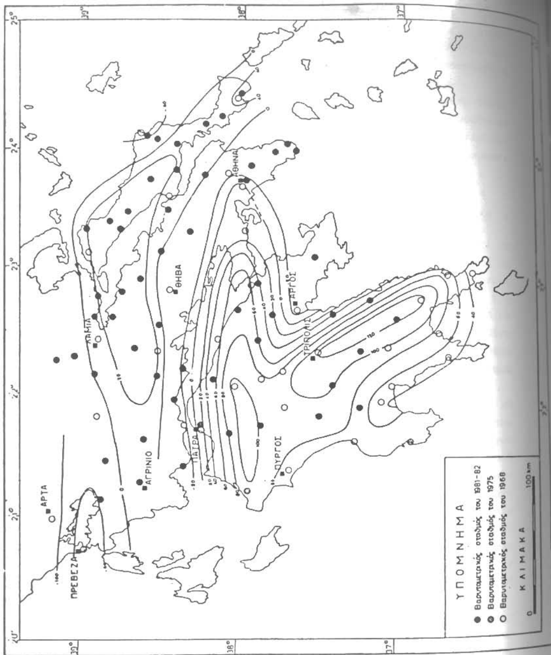
Σχήμα 3 Διαφορές Βαρύτητας (σε \mu\text{gals} ), που προέκυψαν στά βαρυτομετρικά δίκτυα της Πελοποννήσου και Στερεάς Ελλάδας κατά την περίοδο 1968-1981/82.

σεισμών. Αυτό είναι δυνατόν να επιτευχθεί με τοπική πύκνωση και συχνότερη επαναμέτρηση του δικτύου.