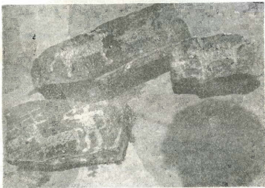
Έλαφοι καί κυνηγοί λαξευμένοι επί λίθων.

διεπιστώθη ή ύπαρξις έτέρων 2 λίθων μέ λαξευμένας παραστάσεις άγνώστου πρόελεύσεως τοποθετηθέντων κατά τό κτίσιμον του μανδρότοιχου υπό άνιδέων χωρικών μή ζώντων σήμεραν.