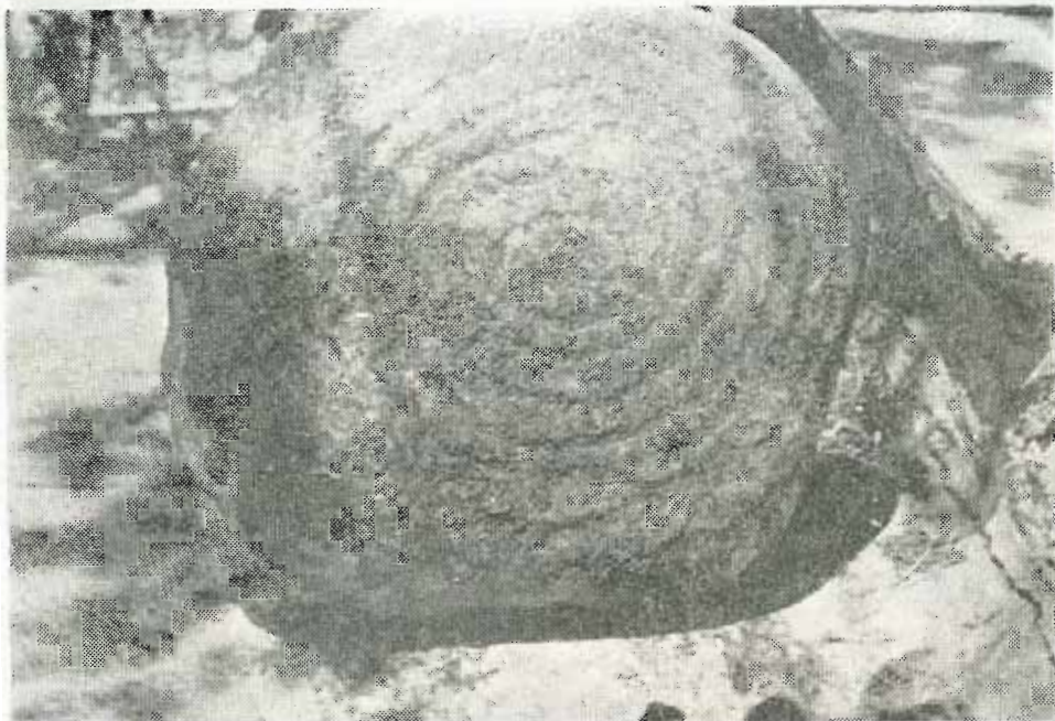
Κοχλίας λαξευμένος ἐπὶ λίθου.