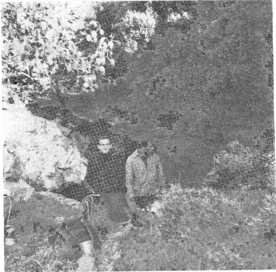
Τεράστια κολώνα στὴ πρώτη σάλι.

Ὁ κεντρικὸς θάλαμος εἶναι ὁ μεγαλύτερος καὶ παλαιότερος τῶν δύο προαναφερθέντων, διαστάσεων 30 \times 5 - 7 \times 4,5 - 0,6 μ.