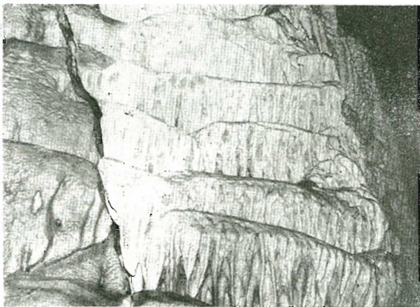
Λιθωματικό ύλικό στα τοιχώματα

Τό σπήλαιον δέν θεωρείται τουριστικόν πρώτον για τό μικρό μέγε-