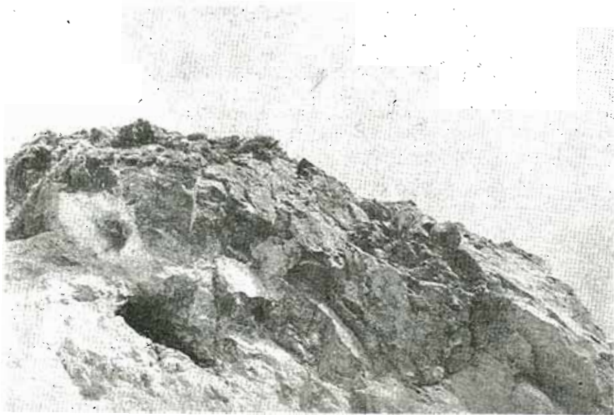
Ἡ εἴσοδος τοῦ σπηλαίου διακρίνεται καὶ τμῆμα τοῦ λατομείου.

Ὁ ἐργολάβος φοβούμενος τὴν διακοπὴ τῶν ἐργασιῶν τοῦ λατομείου ἀπὸ τὴν ὕπαρξι τοῦ σπηλαίου ἀνετίναξε αὐτὸ καταστρέφοντας τοὺς δια-