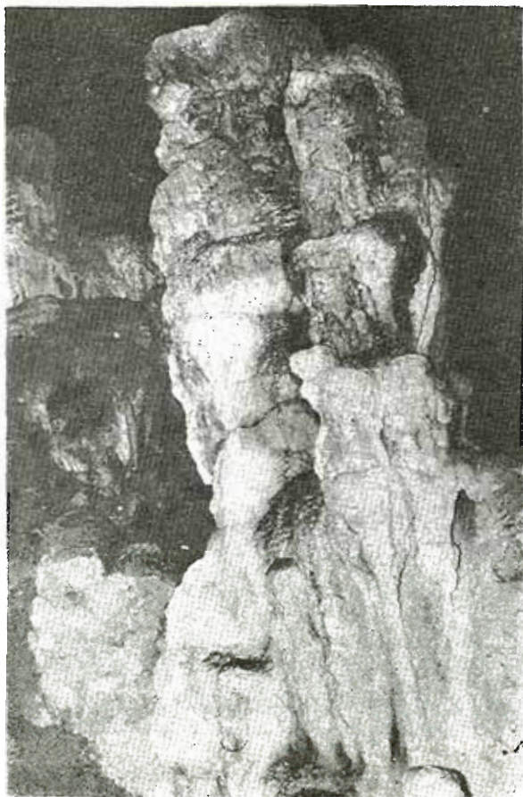
Οἱ πρῶτοι σταλακτίτες στὴν ἀρχὴ τοῦ μεγάλου θαλάμου.

Τὸ πρῶτο τμῆμα τῆς εἰσόδου εἶναι θάλαμος τεχνητὸς πού διανοίχ-