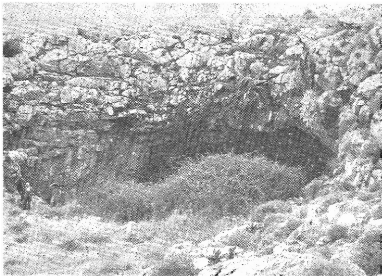
Τμήμα τῆς μεγάλης δολίνης ὅπου ἡ εἴσοδος τοῦ σπηλαίου Ἁγίας Παρασκευῆς.