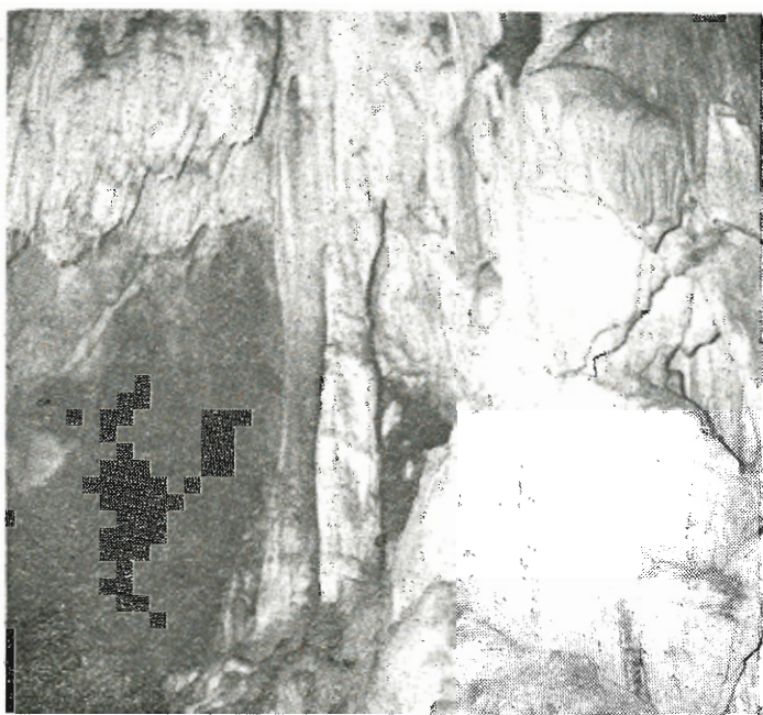
Ὡραιότατος σταλακτιτικὸς διάκοσμος.

Πρὸς τὸ τέλος τοῦ ἀριστερὰ διάβασις πλάτους 4 μ. — πρὸς τὰ δεξιὰ του ἀνηφορικὸς — ὁδηγεῖ εἰς ἄλλον διάδρομον διαστάσεων 10 X 3 — 6 X 2 — 3 μ.