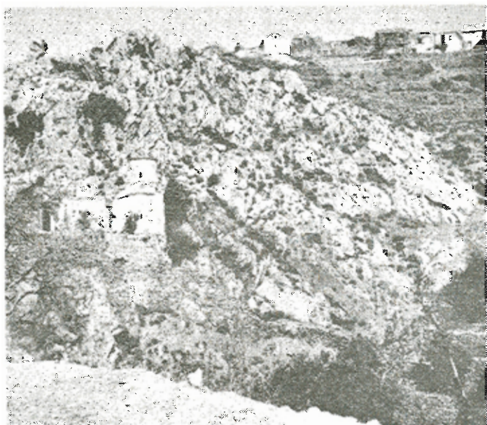
Ἡ Ἐκκλησοῦλα Ἀγιογαλούσαινα. Πάνω της τὸ χωριὸ Ἅγιον Γάλας καὶ δεξιὰ της ἡ εἴσοδος τοῦ σπηλαίου.

Τὸ τμήμα τῆς Ἑλληνικῆς Περιηγητικῆς Λέσχης Χίου ἐνδιαφερόμεν διὰ τὴν τυχὸν τουριστικὴν ἀξίαν τοῦ σπηλαίου, ἐκάλεσε τὴν γράφουσαν τὸ 1964 διὰ τὸν χαρακτηρισμὸν του. Κατόπιν τῆς διαπιστώσεως τῆς μεγάλης τουριστικῆς καὶ ἐπιστημονικῆς ἀξίας τοῦ σπηλαίου ἡ Ἑλληνικὴ Σπηλαιολογικὴ Ἑταιρεία συμπεριέλαβε τοῦτο εἰς τὸν πίνακα τῶν πρὸς ἐξερεύνησιν σπηλαίων τοῦ 1969. Ἡ ἐξερεύνησις του ἐπραγματοποιήθη τὸν Νοέμβριον τοῦ 1969 ἐντολῇ Ε.Σ.Ε. χορηγία Ε.Ο.Τ. ὑπὸ τοῦ ζεύγους Ε. καὶ Ι. Γκουρδέλου μελῶν τῆς Ε.Σ.Ε. καὶ ὑπὸ τὴν ἀρχηγίαν τῆς γραφούσης.