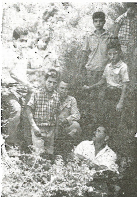
Άριστερό τμήμα εισόδου σπηλαίου «Άνθρωπογράβας»

Από την βάση της καταβάσεως ανοίγεται θάλαμος καταφορικός μήκους 27 μ. με πλάτος 20 μ., το ύψος φθάνει από 2 μ. έως 0,5 μ. Στην αρχή της καταβάσεως υπάρχουν δύο μεγάλοι ογκόλιθοι που φθάνουν έως την οροφή, περνάμε κυκλικά γύρω από τους ογκόλιθους με πολύ μεγάλη κλίση περίπου 75 μοίρες. Το δάπεδο