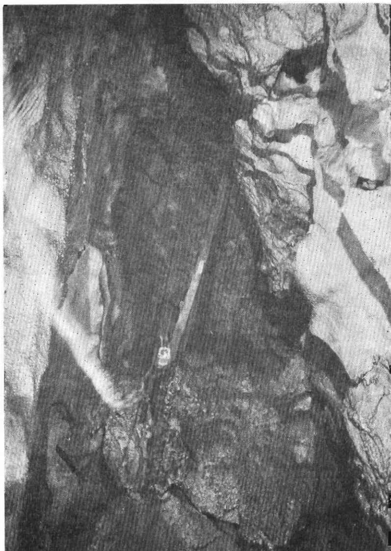
Ἀπὸ τὸν ἐξῶσθη τοῦ προτελευταίου ὁρόφου πρὸς τὸν τελευταῖον ὄροφον. Διακρίνεται ἡ τοποθετημένη ἀκάλα διὰ τὴν πρόσθασιν καὶ στὴν βάσιν τῆς φανός.

Τὸ καταπληκτικώτερον ὅμως θέαμα παρουσιάζει ὁ ἀμέσως μετὰ τὴν προαναφερθεῖσαν διάθασιν διανοιγόμενος πολὺ κατηφορικός διάδρομος διαστάσεων 5X7 — 3X4,5. Ὅλοι οἱ τοῖχοι ἐδῶ εἶναι καλυμμένοι μὲ παραπεσματσοειδεῖς σταλακτίτας καλυμμένους μὲ κοράλλια, ἕπως ἐπίσης καὶ τὸ δάπεδόν του ἔχει καλυφθεῖ ἀπὸ τὸν ἴδιον κοραλλοσειδῆ διάκοσμο παρουσιάζοντας ὄνειρῶδες θέαμα.