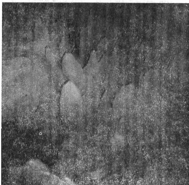
Σταλακτιτικὸς διάκοσμος εἰς τὸ ἐσωτερικὸν τῆς Καταβόθρας.

Τὸ δεύτερον τμήμα διαστάσεων: 49X12—20X3—5 μ., στρέφει κατὰ πρῶ- τον πρὸς τὰ δεξιὰ καὶ ἀκολουθῶς πρὸς τὰ ἀριστερά. Ὅλον τὸ ἀριστερὸν τμήμα τοῦ βαπέδου του καλύπτεται μὲ μεγάλας ποσότητας λασπώδους ἄμμου, ποὺ σχη-