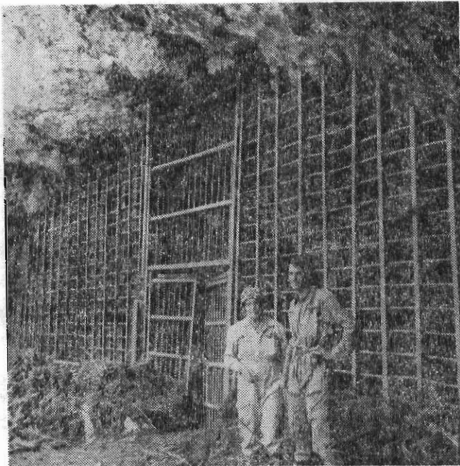
Ἡ εἴσοδος τῆς καταβόθρας Νεστανῆς κατὰ τοὺς θερινοὺς μῆνες.

Εύρίσκεται πρὸς Β. τοῦ χωρίου Νεστανή ἐντὸς ἐκτεταμένης πόλγης εἰς ἀπόστασιν ἀπὸ αὐτὸ 00.20' πεζῇ, μετὰ τοῦ ὁποῦ συνδέεται διὰ χωματοστρώτου ἀμαξιτῆς ὁδοῦ — ἐν μέρει — καὶ ἐν συνεχείᾳ διὰ περιστροφικῆς ἀτραποῦ μέχρι