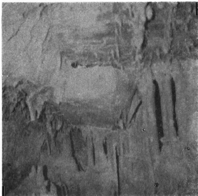
Σπήλαιο Ἁγίου Ἰωάννου Καρρέα Τμήμα τοῦ τέλους του δεξιά.

σ' άλλο επίπεδο σάν πατάρι σχεδόν παράλληλο στο άνοιγμα τής εισόδου. Στο κέντρο δεξιά στο δάπεδο δύο σπασμένοι σταλαγμίτες, και προς τὸ τοίχωμα εἶναι πλούσιος λιθωματικός διάκασμος ἀπὸ κολῶνες και σταλαγμίτες κυρίως, πάνω σ' ὀγκόλιθους πὺ ἔχουν καταπέσει παλαιότερα σ' ὅλο τὸ δάπεδο τοῦ σπήλαιου ἀπὸ τὴν ὄροφή, ἴσως μετὰ ἀπὸ σεισμό.