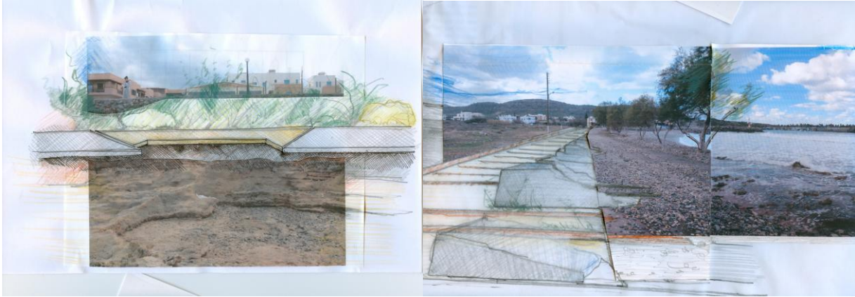
Εικόνα 3. Προσχέδια μελέτης με στρώσεις πεζοδρόμου προσαρμοσμένες σε φυσικές δομές