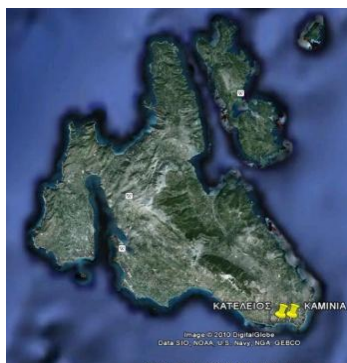
Σχήμα 1. Γεωγραφική θέση της περιοχής μελέτης (Όρμος Κατελειού) στο χάρτη της Νήσου Κεφαλληνίας

Η Κεφαλονιά αποτελεί ένα νησί με έντονη τεκτονική δραστηριότητα ευρισκόμενη κοντά στην ελληνική τάφρο, γεγονός που επηρεάζει και την περιοχή μελέτης με τεκτονικές μετατοπίσεις άλλοτε σύμφωνες με εκείνες του υπόλοιπου νησιού και άλλοτε όχι. Έτσι, από τον Σεπτέμβριο του 2001 έως τον Σεπτέμβριο του 2003, οι οριζόντιες μετατοπίσεις ήταν αρκετά μικρές σε όλο τη νησί με μεγαλύτερες τιμές (10-12 mm) στο ΝΑ τμήμα του νησιού (Lagios et al., 2007). Από την άλλη πλευρά, ενώ ανοδικές κινήσεις παρατηρήθηκαν σε ολόκληρη τη νήσο στο ΝΑ τμήμα του νησιού καταγράφηκε υποχώρηση (3-20 mm), η οποία συνεχίστηκε συστηματικά στο αμέσως ακόλουθο χρονικό διάστημα (Σεπτ. 2003 – Φεβρ. 2006) με περαιτέρω βύθιση 32 mm.