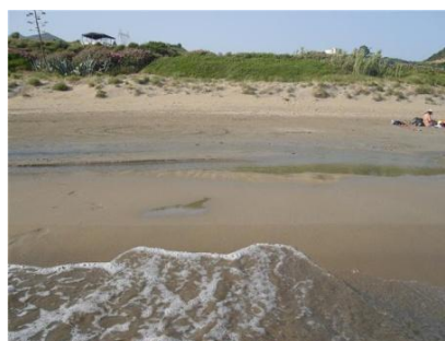
Σχήμα 3. Το ανατολικό άκρο της παραλίας του Κατελειού (αριστερά) και το πεδίο θινών στην παραλία των Καμινίων (δεξιά).

Κατά κύριο λόγο η παραλία του Κατελειού χαρακτηρίζεται από την ύπαρξη άμμου με την παρουσία λίγων χαλικιών ((g)S) ενώ η ζώνη διαβροχής συναντάται σε απόσταση 3 m από το μέτωπο της παραλίας. Το ανατολικό τμήμα της παράκτιας ζώνης είναι σχεδόν αμιγώς αμμώδες (μικρή παρουσία κροκάλων) μεταπίπτοντας σταδιακά προς δυτικά σε μεικτής σύστασης για να