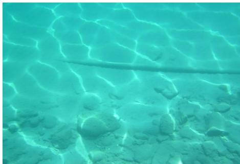
Σχίμα 4. Φωτογραφική απεικόνιση του αποκλυμμένου ενεργειακού καλωδίου της ΔΕΗ σε ~ 7,5 m

καταλήξει βραχώδες στο δυτικό της άκρο. Υποθαλάσσια έχουμε τη παρουσία βραχώδους υποστρώματος σε βάθος περίπου 2m (τομές A2) ενώ στις τομές A1 και A3 έχουμε τη παρουσία αμμωδών υβωμάτων. Η αποκάλυψη του ενεργειακού καλωδίου, κοντά στο άξονα της τομής A2 (κεντρικό τμήμα) σε βάθος >5 m (Σχ. 3) μαρτυρά σημαντική μεταβολή του υποθαλάσσιου ανάγλυφου, καθώς κατά τη προσαιγιάλωση τα καλώδια θάβονται περισσότερο από 0,5 m.