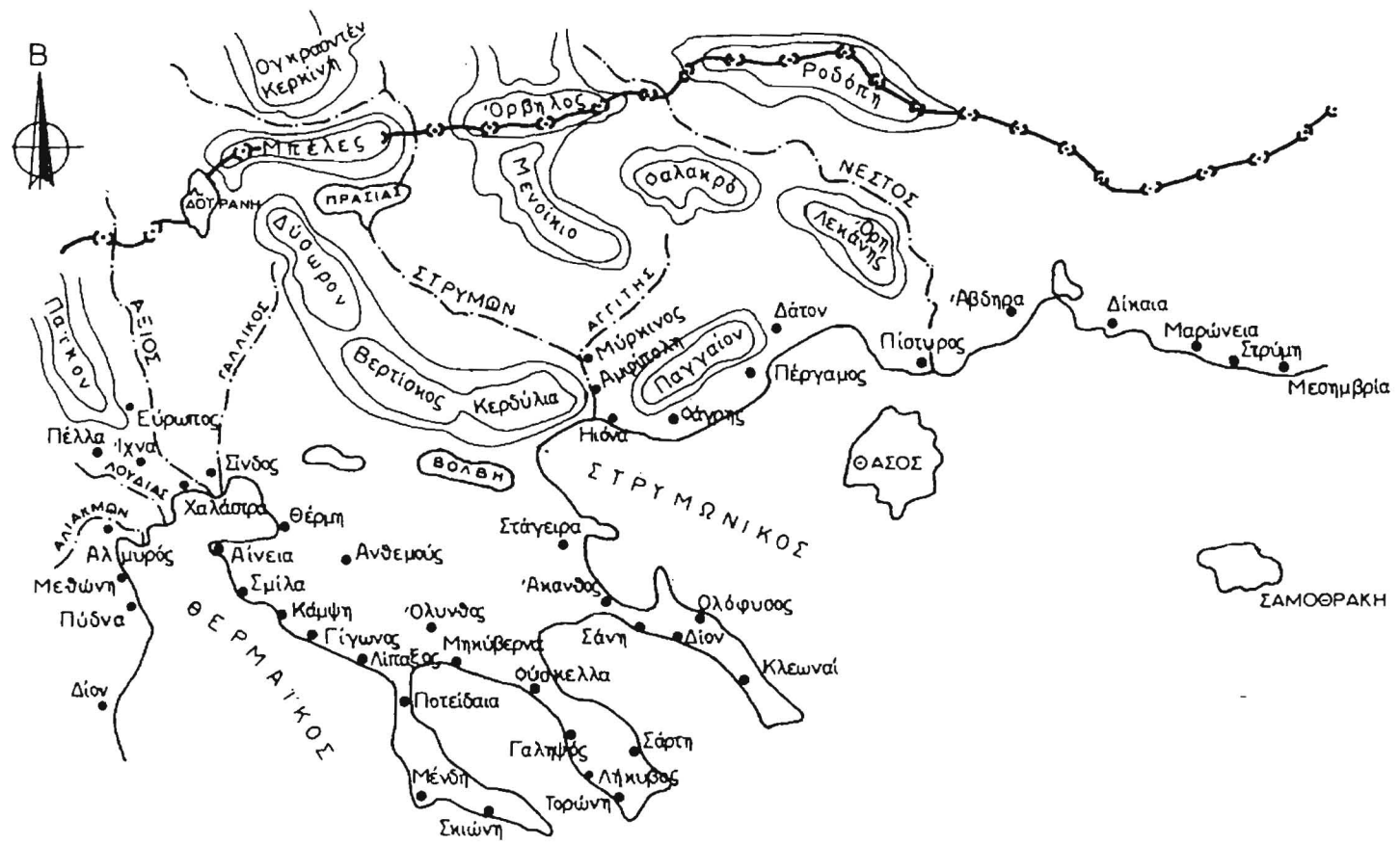
Σχ. 3 - Ελληνικές απορροές - 5ος + Χ αιώνας Ψηφιακή Βιβλιοθήκη Θεοφράστου - Τμήμα Γεωλογίας, Α.Π.Θ.