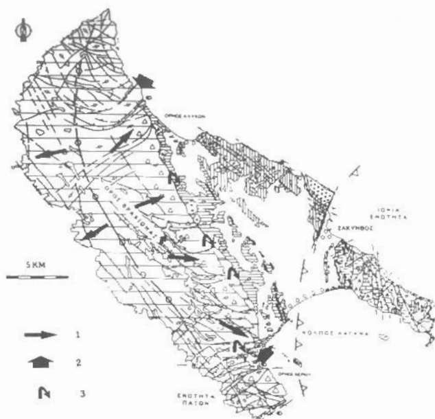
Εικ. 5: Γεωλογικός χάρτης της Ζακύνθου με τις διευθύνσεις ροής υπόγειων υδάτων στο όρος Βραχίωνα (1), τις διευθύνσεις διείσδυσης του θαλάσσιου νερού (2), τις θέσεις των γεωτρήσεων κύριας εκμετάλλευσης υπόγειων νερών (3).