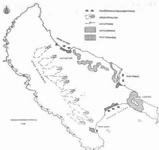
Εικ. 4: Περιοχές της Νήσου Ζακύνθου στις οποίες αναμένεται η εκδήλωση ορισμένων γεωπεριβαλλοντολογικών προβλημάτων.