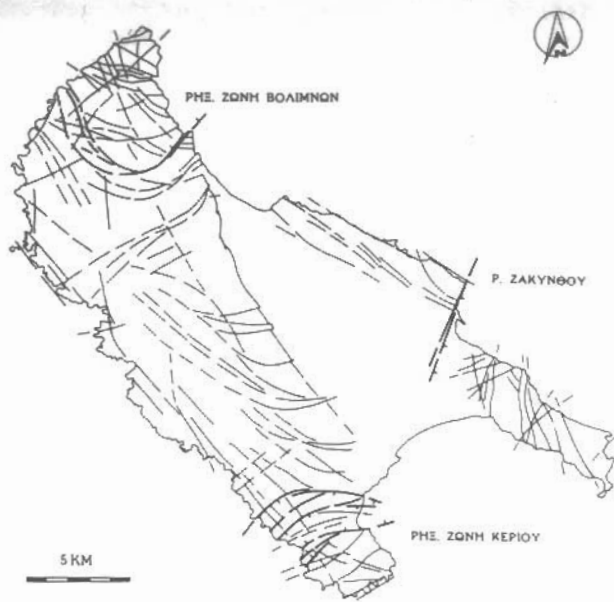
Εικ. 2: Ο ρηξιγενής ιστός της Ζακύνθου (ΛΕΚΚΑΣ, 1993) και τα σημαντικότερα ενεργά ρήγματα - ρηξιγενείς ζώνες (έντονος συμβολισμός).