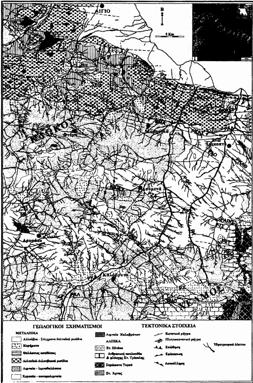
Εικ.2. Απλοποιημένος γεωλογικός χάρτης της ευρύτερης περιοχής Αιγιαλείας και Καλαβρύτων (περιοχή φύλλου ΑΙΓΙΟ).