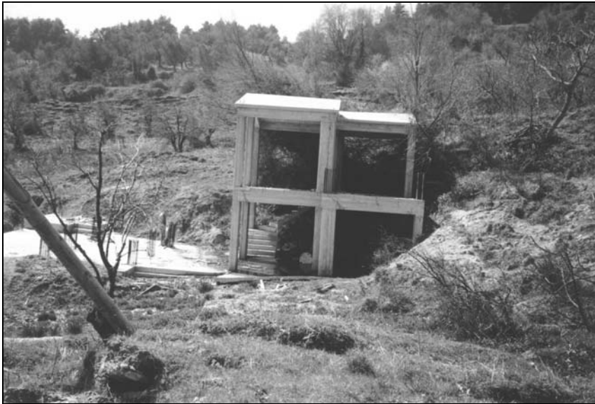
Σχήμα 2. Καταστροφικές συνέπειες της κατολίσθησης.