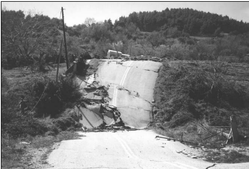
Σχήμα 1. Αναθόλωση των εδαφικών μαζών στη στροφή του αυτοκινητόδρομου με έντονη παραμόρφωση και μεταβολή της μορφολογίας.

Οι νεογενείς αποθέσεις στη Βόρεια Εύβοια και ασφαλώς και στην περιοχή της Αγίας Άννας σύμφωνα με το γεωλογικό χάρτη του ΙΓΜΕ, αποτελούν «αδιαίρετη ομάδα από λεπτομερή καταρχήν υλικά και ιδιαίτερα λευκοκίτρινες μάργες και ψαμίτες, λιγότερα ψηφιδοπαγή και κροκαλοπαγή και πυκνή στο χώρο εναλλαγή των διαφόρων μελών της ομάδας και μερικές φορές με διασταυρωμένη στρώση πάχους 300 m».