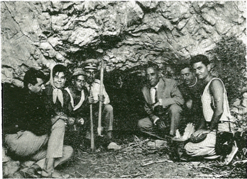
Ἡ εἴσοδος τοῦ σπηλαίου Ἀγ. Ἰσιδώρου Πλωμαρίου Λέσβου

Ιον) Ὅτι τὸ σπήλαιον ἐκτείνεται πρὸς Β. εἰς μῆκος περὶ τὰ 30.00 μ.,