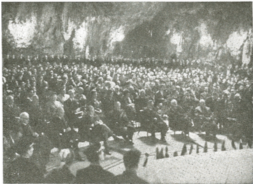
Ἡ πανηγυρική συνεδρίασις ἐνάρξεως τοῦ IV Διεθνoῦς Σπηλαιολογικοῦ Συνεδρίου

τουρισμό στις σπηλιές, τις φυσικοχημικές θάσεις της καρστικής διαβρωτικής και για την δοήθεια και τη διάσωση μέσα στα σπήλαια. Τρεις επιτροπές καταπιαστήκαν με την σπηλαιολογική όρολογία, τη χαρτογράφηση και τα σύμβολά της και την συγκέντρωση από στοιχεία για τις μακρύτερες και βαθύτερες σπηλιές. Μια παραστατική έκθεση έδειξε συγκεντρωμένα στοιχεία για τις «Σπηλιές και το Κάρστ». Ἀκόμα Γιουγκοσλάβοι και Βέλγοι σπηλαιολόγοι πραγματοποίησαν μιάν ἐξαιρετικά ἐνδιαφέρουσα ἐπίδειξη διάσωσης με «τραυματίες» σπηλαιολόγους μέσα στις σπηλιές.