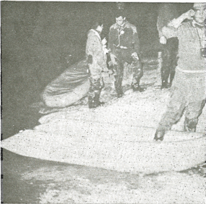
Στόν υπόγειο ποταμό Κρίτσνα. Ψηφιακή Βιβλιοθήκη Θεόφραστος - Τμήμα Γεωλογίας, Α.Π.Θ.