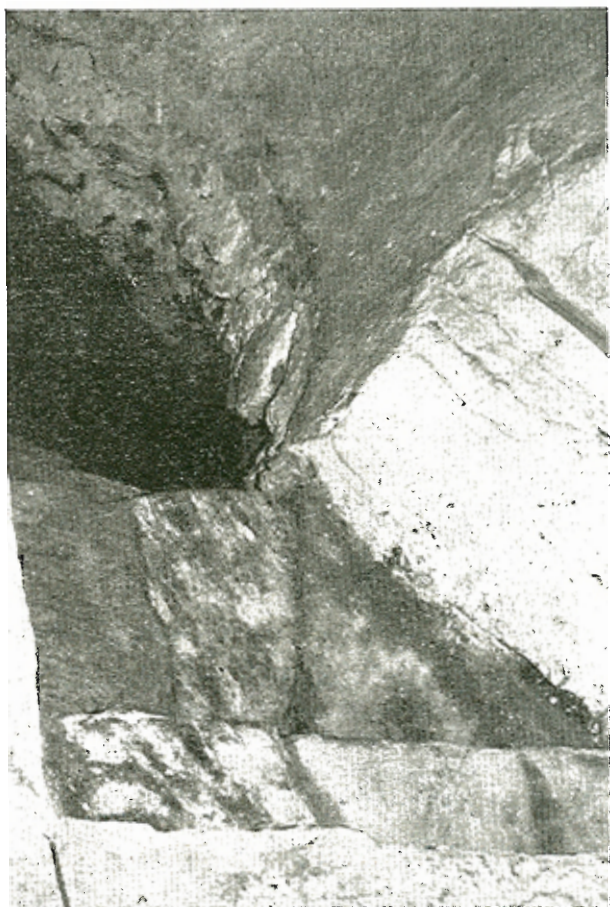
Τὸ ἄγισμα (νερὸ) τῆς Παναγίας Γορίτσας,

Τὸ καθ' αὐτὸ σπήλαιον προφυλάσσεται ἀπὸ τὸ θαλάσσιον κύμα μετὰ ἕνα πρόναον κτιστό. Ἀπὸ εἴσοδον διαστάσεων 1 \times 1,8 μ. καὶ μετὰ τρία σκαλιὰ κατα-