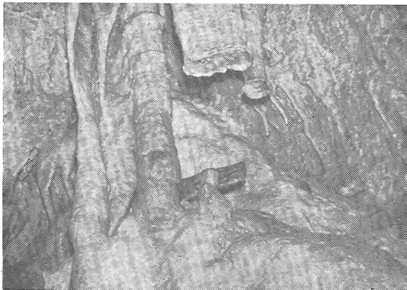
Χαρακτηριστικὸς διάκοσμος τοῦ Νέου Τμήματος.

Κατὰ τὴν ἐξερεύνησιν τοῦ «Νέου Τμήματος» διεπιστώθη, ὅτι ἡ διάνοιξις τοῦ