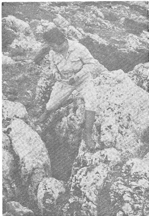
Ἐκ τῶν ἔξω, τοῦ σπηλαίου «Κολάκα».

Ἡ εἴσοδος τοῦ σπηλαίου εἶναι διάδρομος μήκους 8 μ. πού καταλήγει σέ μικρὸ θάλαμο διαστάσεων 7 μ. X 7 μ. Στὴν ὀροφή τοῦ θαλάμου και σέ ὕψος 6 μ. ὑπάρχει φεγγίτης, παλαιὰ μαρμίττα, πού φωτίζει και τὸ σημεῖο αὐτὸ τοῦ σπηλαίου. Ἀκολουθεῖ ὁ μεγάλος κεντρικὸς θάλαμος μήκους 27 μ. και πλάτους 18 μ. Τὸ ὕψος κειμέ-