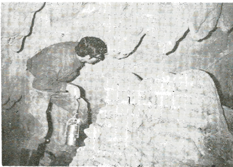
Σταλακτιτικός διάκοσμος εἰς τὴν «Στοάν» τῶν λευκῶν σταλακτιτῶν.

Ἀριστερὰ τῆς «Μεγάλης Αἰθούσης» ὑπάρχουν δύο στοαί (ἢ μία ὀνομασθεῖσα «Τῶν λευκῶν σταλακτιτῶν») μήκους 20, πλάτους 3, καὶ ὕψους 3 μέτρων περίπου ἐκάστη, κοσμούμενη ὑπὸ ὠραιστάτων λευκῶν καὶ ποικίλων μορφῶν σταλακτικῶν καὶ σταλαγματιῶν. Ὑπάρχουν πολλὰ πιθανότητες κατοικήσεως τοῦ σπηλαίου ὑπὸ τῶν προϊστορικῶν ἀνθρώπων. Ξένοι ἀρχαιολόγοι ἠσχολήθησαν ἐπανειλημμένως μὲ ἐρεῦνας ἐξώθεν τοῦ σπηλαίου. Τὰ ἀποτελέσματα ὅμως δὲν εἶναι γνωστά.