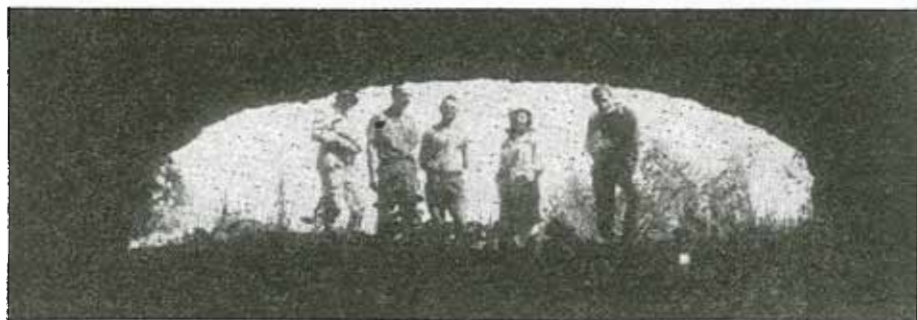
Ἡ εἴσοδος τοῦ Σπηλαίου ἐκ τῶν ἔσω πρὸς τὰ ἔξω.