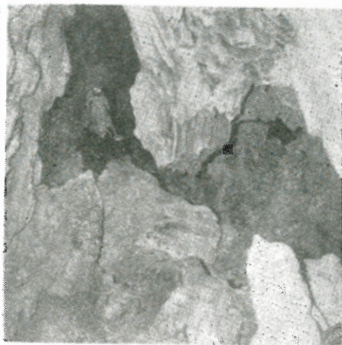
Διάκοσμος στὸν πρῶτο δάλαμο.