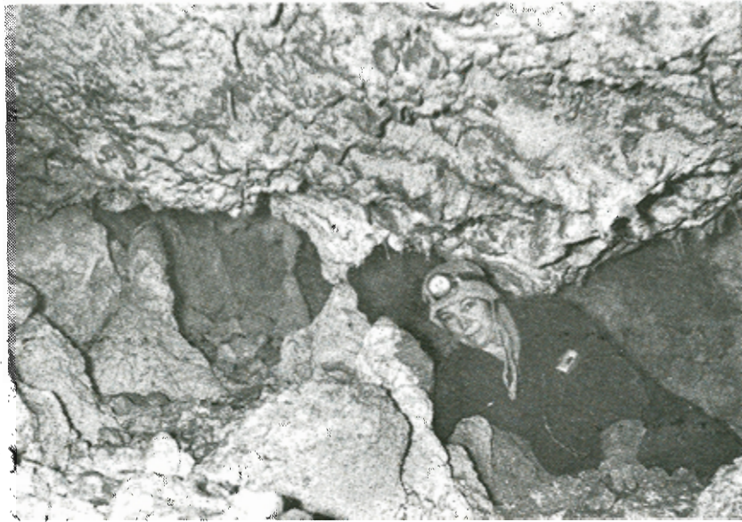
Διάκοσμος σὲ χαμηλότερα ἐπίπεδα.

Πρὸς τὸ ἀριστερὸν τέλος τοῦ θαλάμου —πολὺ ἀνηφορικὸν— διανοίγεται διά- βασις πλ. 1 X ὕψ. 2,5 πολὺ μεγαλοπρεπῆς, ὀδηγοῦσα εἰς ἄλλον θάλαμον διαστά- σεων 19X11X1,5—6μ. ὁ ὁποῖος πρὸς τὰ δεξιὰ εἶναι πολὺ κατηφορικὸς καὶ δια- κοσμημένος μὲ σειρὰς σταλαγμιτῶν καὶ ἐντυπωσιακῶν σταλακτιτῶν. Κυρίως ὁ δε- ξιὸς τοῦ τοῖχος εἶναι πολὺ ἐντυπωσιακός. Πρὸς τὸ τέλος τοῦ διανοίγεται μεγαλο- πρεπῆς διάβασις πλάτους 2X3μ. ὀδηγοῦσα εἰς τὸν τρίτον κατὰ σειρὰν θάλαμον δια-