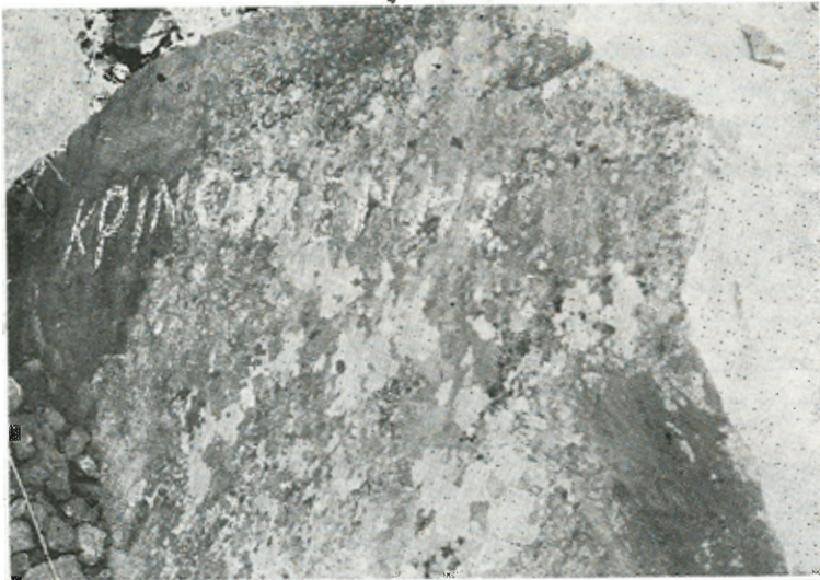
Ἡ ἐπιγραφή «ΚΡΙΝΟΜΕΝΗΣ» πού ἀνακαλύφθηκε στό μονοπάτι μεταξὺ τοῦ δημοσίου δρόμου Φηρῶν—Οἴας καί τῆς Ἐκκλησίας τῆς Κερά - Παναγιᾶς. Μὲ ἐλαφρόπετρα χαράξαμε τὸ λάξευμα τῶν γραμμάτων γιὰ νὰ τὸ φωτογραφίσουμε