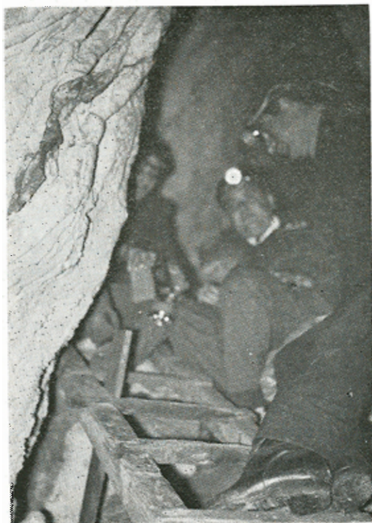
Σημεῖο τῆς καθόδου στίς σιδερένιες σκάλες.

Τὸ ἀριστερὸ τμήμα, μέ μῆκος 12μ. καὶ πλάτος 5,5μ., χωρίζεται σέ δύο διαδρόμους ἀπὸ μεγάλο ὀγκόλιθο μῆκους 10μ. καὶ πλάτους ἕως 2μ. Στὸ τέλος δεξιά τοῦ διαδρόμου ξύλινη σκάλα. Δεξιά στενὸς κατηφορικὸς διάδρομος καταλήγει στὴν λίμνη πού ἔχει διαστάσεις 1,5μ. X 0,6μ. καὶ βάθος νεροῦ 0,6μ.