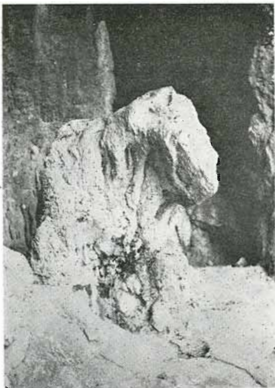
· Ἡ ἀρκούδα.

Τὸ κεντρικὸν τμήμα του εὐρίσκεται εἰς ὑψηλότερα ἐπίπεδα τῆς εἰσόδου του, με ὕδατοςυλλογὴν ἀπὸ σταγονοροσὴν. Πρὸς τὰ δεξιὰ τῆς εἰσόδου κατηφορίζει ἐλαφρῶς, ἐνῶ πρὸς τὸ τέλος του κατηφορίζει ἀποτόμως, ὅπου διανοίγεται πολὺ κατηφορικὸς θαλαμίσκος, διαστάσεων 13X6X3 κλεισμένος πρὸς τὸ τέλος του με ὀγκολίθους ἐμποδίζοντας τὴν δρατότητα. Ὀγκολίθοι διαφόρων μεγεθῶν καλύπτουν ἐπίσης τὸ δάπεδόν του ἐπὶ τῶν ὁποίων —εἰς πολλὰ σημεῖα— ἔχουν ἀναπτυχθεῖ σταλαγμίται με ὠραιότατα σχήματα καὶ χρώματα. Τόσον ἡ θέα ἐκ τῆς εἰσόδου πρὸς τὸ ἐσωτερικὸν ὅσον καὶ ἐκ τοῦ ἐσωτερικοῦ πρὸς τὴν εἴσοδον εἶναι θαυμασία καὶ μεγαλοπρεπής.