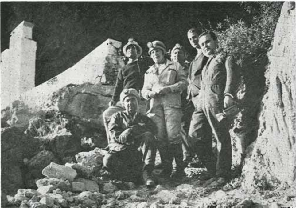
Τὸ συνεργεῖο τῆς Ε. Σ. Ε. ἔξω ἀπὸ τὴν εἴσοδον τοῦ σπηλαίου.

Π ρ ο σ π έ λ α σ ι ς : Τὸ σπήλαιον συνδέεται μετὰ τὴν πόλιν τῶν Χανίων δι' ἀμαξιτῆς ὁδοῦ καλῆς καταστάσεως —μὴ ἀσφαλτοστρώτου— μήκους 48χμ. Ἐν συνεχείᾳ διὰ μονοπατίου ἀρκετὰ ἀνηφορικῶς μέχρι τὴν εἴσοδον τοῦ σπηλαίου. Ὑψομετρικὴ διαφορά 80μ.π.