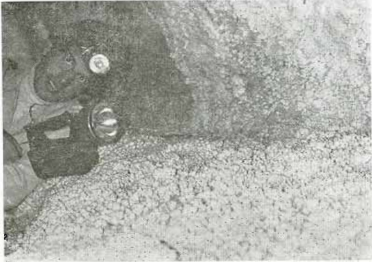
Ἕνα θαυμάσιο δάπεδο ἀπὸ σταλακτιτικὸ ὕλικό.

Δ ι α σ τ ἄ σ ε ι ς : Τὸ κατ' εὐθείαν γραμμὴ μῆκος τοῦ σπήλαιου Λευκοπέτρας εἶναι 32μ. Τὸ μεγαλύτερο ὕψος 4,5μ. καὶ τὸ μεγαλύτερο πλάτος εἶναι 7μ. Τὸ σπήλαιο καταλαμβάνει ἕκτασιν 140 τετραγωνικῶν μέτρων.