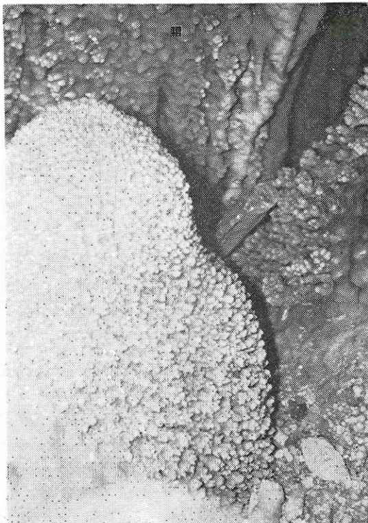
Ένας καταπληκτικός σταλαγματίης στο άριστερό τμήμα.

Στά 6μ. στήν όροφή ύπάρχει καπνοδόχος χωρίς νά φαίνεται τó τέλος του και είναι πολύ στενό για νά έρευνηθῆ. Στό αυτό σημείο δεξιά θράχος πού κρέμεται στήν όροφή είναι από τά πιό όμορφα σημεία τού σπηλαιού. Όλόκληρο τó δεξιό τοίχωμα και τó δάπεδο είναι καταστόλιστα από ανακρυσταλλώσεις. Τό άριστερό τοίχωμα έως τó τέλος έχει μικροεσοχές και πολλές μικρές κολώνες. Τό τελευταίο τμήμα τού σπηλαιού έχει πλούσιο σταλαχτιτικό και σταλαγματικό διάκοσμο και συγχρόνως τó σεβαστό ύψος έω στα 3,5μ. τῆς όροφῆς επιτρέπει κάποια εύρυχωρία, ενώ στήν είσοδο πρós τόν τελευταίο θάλαμο χρειάζονται ακροβατικές ικανότητες για νά εισέλθη κανείς στό έσωτερικό του.