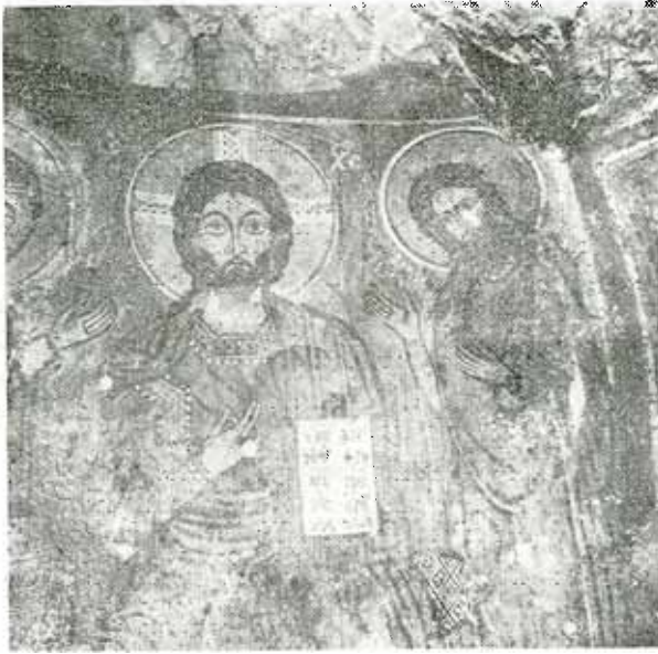
Λεπτομέρειαι ἀπὸ τῆς δαυμάσιος τοιχογραφίας τοῦ τέμπλου.

Πρὸς τὰς διευθύνσεις αὐτῶν τῶν διακλάσεων εἶναι προσανατολισμένοι καὶ οἱ ἔρβοι τοίχου καὶ τὰ ὑπολείμματα τῶν παλαιῶν σπηλαίωτ, ποὺ διακρίνονται ἐντὸς τῆς πρὸ τοῦ σπηλαίου κοιλάδος.