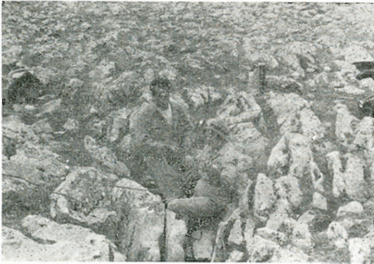
Η έμμοδα έρεύνης στην είσοδο του σπηλαίου Έρμακιάς.

Ο κεντρικός θάλαμος χωρίζεται σε τρία τμήματα από δυο σειρές κολωνών που τον διαπερνούν σε όλο το μήκος του. Η διάταξις αυτή του λιθωματικού διακόσμου είναι πολύ μεγάλο πλεονέκτημα για την τουριστική διαδρομή του σπηλαίου. Η πρώτη σειρά των κολωνών είναι θαυματική γιατί οι κολώνες έχουν αξιόλογο ύψος έως 6,50 μ. Με αυτό τον τρόπο θα μελετήσουμε τον θάλαμο σαν 3 διαφορετικά τμήματα, το δεξιό τμήμα, το μεσαίο και το άριστερό τμήμα.