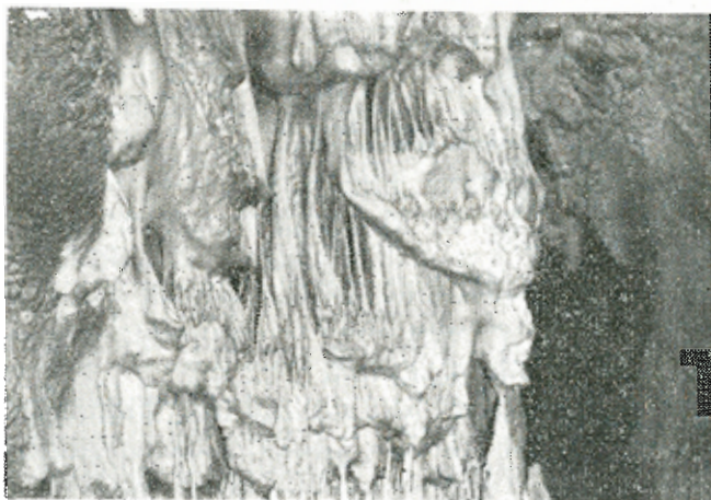
Ἐνα τμήμα τοίχου ἀπὸ τὰ ὠραιότερα τοῦ σπηλαιίου.

Διαστάσεις : Τὸ κατ' εὐθείαν γραμμὴ μῆκος τοῦ σπηλαιίου εἶναι 46 μ. Τὸ μεγαλύτερο πλάτος του 15 μ. καὶ ἡ ὑψηλότερη ὄροφός του 7 μ. Τὸ σπήλαιο καταλαμβάνει ἔκτασι 425 τ.μ.