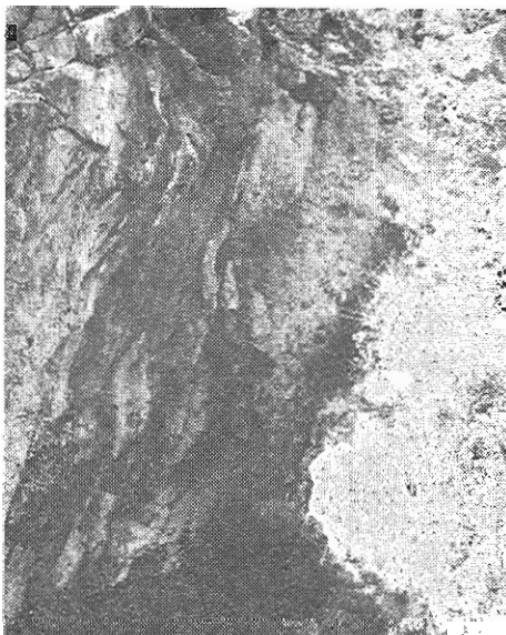
Τὸ κατακρημνισθὲν σπήλαιον τοῦ Ὀδυσσεύς.

Τουρισμός: Παρὰ τὸ πολὺ περιορισμένον μέγεθός του τὸ σπήλαιον ἄγτρον τῶν Νυμφῶν Ἰθάκης, θεωρεῖται ἀξιόλογον τουριστικῶς προσελκῶν πολλοὺς ἐπισκέπτας ξένους καὶ Ἑλληνας, λόγῳ τοῦ πλουσίου διακόσμου του καὶ τῆς συνδέσεώς του μὲ τὴν ἀρχαίαν Ἑλληνικὴν μυθολογίαν. Συνεπικουροῦν πολλὰ ἀξιόλογα σὺνδρομα τουριστικὰ στοιχεῖα, ὅπως: Ἡ θαυμασία διαδρομὴ πρὸς τὸ σπήλαιον μὲ τὴν περιβλεπτοὺν καὶ καταπράσινην τοποθεσίαν, εἰς τὴν ὁποίαν εὐρίσκεται. Οἱ θαυμάσιοι κολπίσχοι μὲ τῖς δαντελωτὰς ἀκτῆς. Τὸ γραφικὸν χωρίον Σταυρὸς ὅπου ἡ