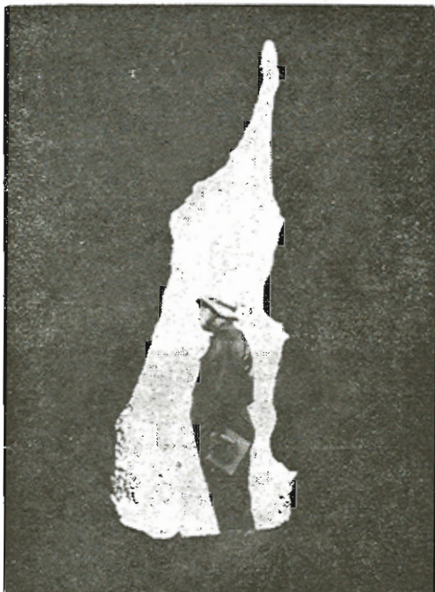
Ἡ εἰσοδος τοῦ Σπηλαίου «Ἄντρον Νυμφῶν» Ἰθάκης.

Πρὸς τὰ ἀριστερὰ τοῦ θαλάμου, εἰς τὴν ὄροφν, ὑπάρχει μικρῶν διαστάσεων ἄνοιγμα ἐν εἰδῇ φωταγωγοῦ, εἰς ὕψος 10 μ. περ. ἐκ τοῦ ὁποίου τὸ εἰσερχόμενον φῶς, ἐν συνδυασμῷ μὲ τὸ εἰσερχόμενον διὰ τῆς εἰσόδου, φωτίζει ἀμυδρὰ τὸ ἐσωτερικὸν τοῦ σπηλαίου προδίδον ὑποβλητικότητα καὶ μυστηριώδη φαντασμαγορίαν εἰς τὸ πειριβάλλον.