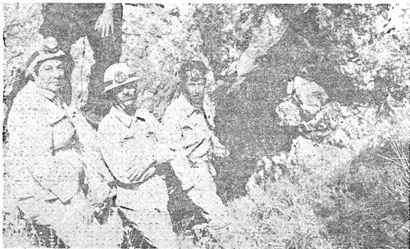
Τὸ συνεργεῖον τῆς Ε.Σ.Ε. παρὰ τὴν εἴσοδο τοῦ ηἱηλαίου.

Ἀκολουθεῖ θαλαμίσκος διαστάσεων 3,5X3X1,5 πρὸς τὰ δεξιὰ, ἐνῶ τὰ ἀριστερὰ ἡ ὄροφὴ τοῦ ἔχει ὕψος 0,30 μ. Τὸ δάπεδόν τοῦ εἶναι καλυμμένον μὲ ἄφθονους λίθους οἱ ὅποιοι ἔχουν προσχώσει τμήμα ὄγκώδους σταλακτίτου, ἀριστερὰ τοῦ ὁποίου διανοίγεται μικρὰ καταβόθρα προσχωμένη ἀπὸ λίθους.