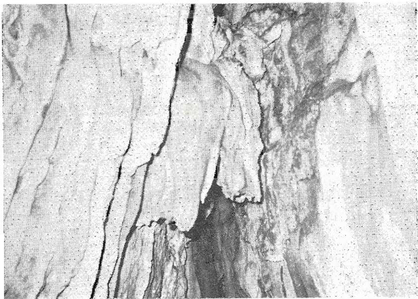
Ὁ μεγαλοπρεπὴς διάκοσμος τοῦ σπηλαίου.

Ἐδῶ τελειώνει τὸ μῆκος τοῦ σπηλαίου. Οἱ τοῖχοι καὶ αὐτοῦ τοῦ τμήματος εἶναι καλυμμένοι μὲ πολύχρωμους καὶ πολὺ ἐντυπωσιακοὺς σταλακτίτας.