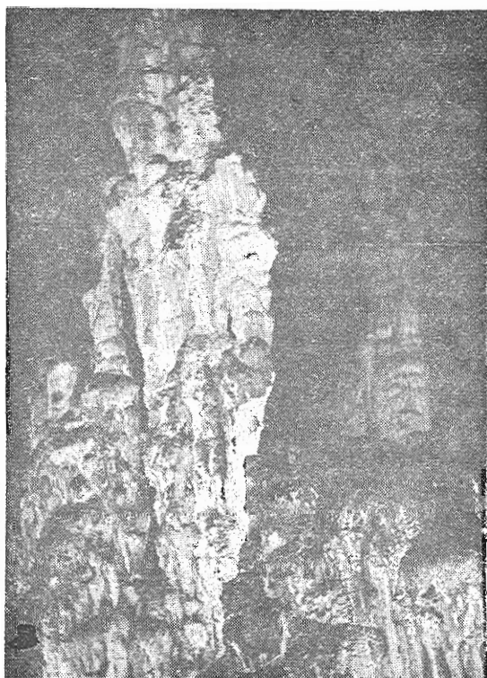
Πανύψηλοι σταλαγμίτες σωστοὶ οὐρανοξύστες.

Ὁ ἀνωτέρω θάλαμος πρὸς τὰ ἀριστερὰ του ἔχει μικρὰν ὀπὴν 0,3X0,3 ὀδηγούσαν εἰς ἄγνωστον τμήμα, ἐνῶ κατὰ μέτωπον διὰ κενοῦ μεταξύ χαμηλῶν στύλων ὀδηγεῖ εἰς ἐπίπεδον θάλαμον διαστάσεων 7X4—7X1—2, 2 μ. Τοῦ ἀνωτέρω θαλάμου τὸ δάπεδον εἶναι καλυμμένον μὲ σπηλαιόγαλα (σπάνιον εἶδος λευκῆς μαλακῆς σταλακτικῆς ὕλης). Ἀκολουθεῖ ἀνηφορικὸς θάλαμος διαστάσ. 8X5X3 μ., ὁ ὁποῖος πρὸς τὰ ἀριστερὰ του χωρίζεται διὰ σειρᾶς λεπτῶν καὶ χαμηλῶν σταλακτικῶν ἀπὸ παράλληλον θάλαμον διαστάσ. 6X4X1 μ. Εἰς τὸ ὑψηλότερον σημεῖον τοῦ