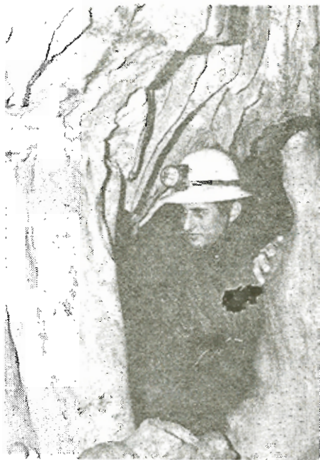
"Υστερα από χαμηλά περάσματα όροφές καταστόλιστες.