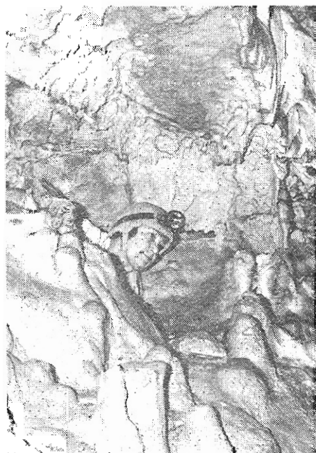
Διάβασις με παραπετασματοειδείς σταλακτίτες