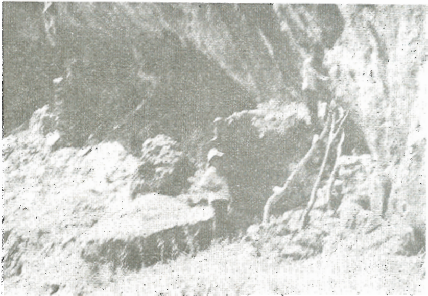
Ἀπὸ τὸ δεξιὸ τμήμα διακρίνεται ἡ πρόχειρη σκάλα πού ὀδηγεῖ στό « Ἀ γ ί α σ μ α ».

Οἱ διαστάσεις τοῦ ανοίγματος εἶναι τὸ πλάτος 12 μ. τὸ μῆκος 15 μ. Ἀριστερὰ ὄλο μεγάλες κολώνες. Δεξιὰ ἀπὸ κατηφορικό θάλαμο θρῖσκόμαστε στὶς δύο ὁπὲς πού εἶχαμε συναντήσει καὶ ἐνώνεται τὸ τμήμα αὐτὸ μὲ τὸ τμήμα ὅπου ὁ πρῶτος τάφος. Συνεχίζει πρὸς τὰ ἀριστερὰ ὁ κατηφορικός θάλαμος μὲ μῆκος ἀπὸ τίς ὁπὲς 10 μ. Δεξιὰ δύο ἕμορφες κολώνες. Ἀριστετέρᾳ στό τέλος θεαματικές ροομορφές πολὺ διακοσμημένες μὲ λιθωματικό ὕλικό.