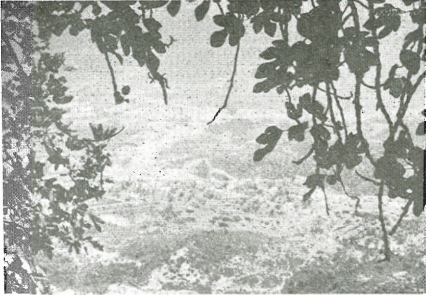
Τὸ χωριὸ Βασιλιὰ ἀπὸ τὴν εἴσοδο τοῦ Σπηλαίου-μοναστηρίου.

3. Ἡ ὀργάνωσις τῆς ἐπισκέψεως τῆς μονῆς μὲ ἄλογα, καθὼς καὶ τῆς δευτέρας μονῆς τοῦ Ἁγίου Νικολάου ποὺ εἶναι καὶ αὐτὴ χτισμένη στὴν Βαράσοβα ἀλλὰ στὴν