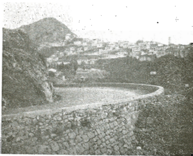
Μερικὴ ἄποψις Λαγκαδίων.

Μυθολογία: Εἰς τὰ Ἀρχαδικὰ Πausanία (170 π.Χ.) ἀναφέρεται ὅτι εἰς τὴν περιοχὴν Καρχαλοῦς — ὅπου καὶ τὸ σπήλαιον — ὑπῆρχε ἄλλοτε ἀρχαία πόλις ἢ Τευθίς. Εἰς αὐτὴν ἀναφέρεται ὅτι ὑπῆρχε μαρμάρινον ἄγαλμα τῆς Ἀθηνᾶς μὲ κόκκινον ἐπίδεσμον εἰς τὸν μηρόν, διὰ τὴν θυμίζουσαν τὸν τραυματισμὸν τῆς ὑπὸ τοῦ Τευτίδος, βασιλέως τῆς Τευτίδος κατὰ τὴν προετοιμασίαν τοῦ Τρωϊκοῦ πολέμου εἰς τὴν Αὐλίδα (ἐρυθρῶ τελαμῶνι κατελιημμένῳ). Ἐπίσης εἰς τὸ 64ον χλμ. — ἀπὸ Λαγκαδία πρὸς Τρίπολιν — ὑπάρχει ἡ πηγὴ Καλονέρι, ἀπ' ὅπου πηγάζει ὁ ποταμὸς Δούσιος. Εἰς αὐτὸν ἐλούετο ὁ Ζεὺς πρὸς ἀναγένεσιν τοῦ σφρίγγου τοῦ καλὸν ἀνήρχετο εἰς τὸ ὄρος Ἀρτοζήνος (ἄρτος - ζήνος) πρὸς συνάντησιν τῆς Ἥρας. Κάτωθεν τοῦ ὄρους ἐκτείνεται ἡ περιοχὴ Ἡραίας, ἐκ τοῦ ἑμωνύμου ναοῦ Ἡραῖον καὶ Λουτρῶν. Πληροφορία: κ. Δ. Λαδοπούλου, Δημοδιδασκάλου.