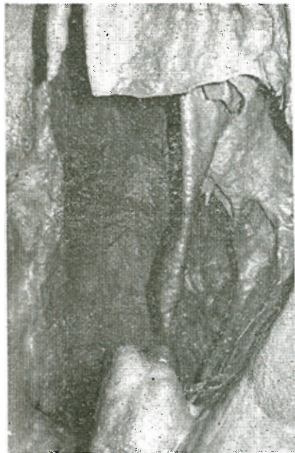
Παραπετασματοειδῆς σταλακτίτης πού θυμίζει γυναικεῖο φῶρεμα καὶ πόδι.

Οἱ τοῖχοι του εἰς ὠρισμένα σημεῖα, εἶναι διακοσμημένοι μὲ σταλακτιτικὸν διάκοσμον. Εἰς ἄλλα ἢ διαβρωτικὴ ἐνέργεια τῶν ὑδάτων, πού τὸν διήνοιξαν φαίνεται εἰς ὅλην της τὴν μεγαλοπρέπειαν. Ὑπολείμματα προσεχόντων βραχυδῶν τμημάτων καὶ ἄλλων πού ὁμοιάζουν μὲ γεφύρας, εἶναι τὰ κυριώτερα χαρακτηριστικὰ αὐτοῦ τοῦ τμήματος τοῦ σπηλαίου.