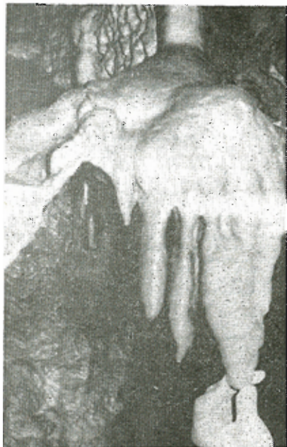
Παράδοξη σταλακτιτική μορφή.

Μετά την εκκένωσιν του ύψηλοτέρου τμήματος του σπηλαιου από τά ύδατα ήρχισεν ή διακόσμησις τής όροφής του από σταλακτίτας.