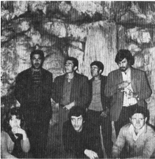
Στο κεντρικό τμήμα του θαλάμου του σπηλαίου.

Το σπήλαιο Λάζος δεν θεωρείται τουριστικού ενδιαφέροντος εξ αιτίας του μικρού του μήκους. Παρ' όλο που ο διάκοσμός του είναι αξιόλογος κυρίως στο άριστερό