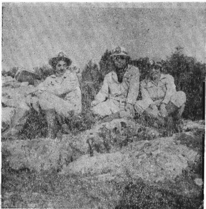
Τὸ κλιμάκιον τῆς Ε. Σ. Ε. παρὰ τὴν εἴσοδον τοῦ σπηλαίου.

Κατόπιν συγεννήσεως μεταξὺ των, αἱ Κοινότητες Κροκεῶν καὶ Δαφνίου,