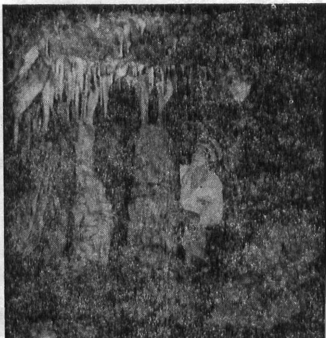
Ὁραιότατες κολῶνες χωρίζουν τὸν Δεύτερον καὶ Τρίτον Θάλαμον τοῦ Δευτέρου Ὀρόφου.