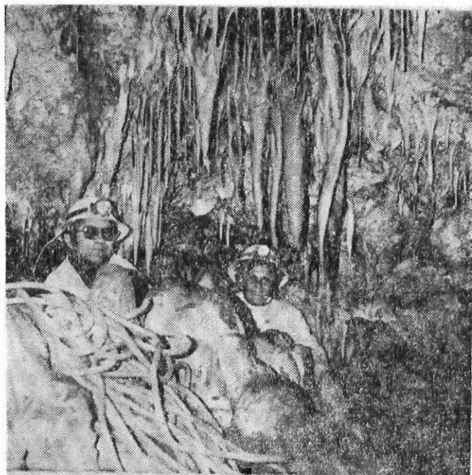
Ἀπό Τέταρτον Θάλαμον Δευτέρου Ὁρόφου πρὸς Τρίτον Ὁροφον.

τέλος του διανοίγεται μεγάλο θάραθρον άγνώστου θάθους. Όλοκληρο το δάπεδόν του είναι καλυμμένο με κυλισθέντας μικρούς και μεγάλους λίθους εις άρκετόν πάχος, ώστε το πρὸς τὰ άριστερὰ τμήμα του, γὰ εφάπτεται με τήν επικλινή δροφήν του. Πιστεύεται ότι με τήν άφαίρεσιν μέρους τῶν λίθων τούτων, θά αποκαλυφθῆ και άλλο πλάτος τοῦ θαλάμου τούτου. Έν ποσοστόν λίθων προέρχεται από τὰς καταβόθρας τοῦ πρώτου δρόφου, ἢ σύνδεσις τοῦ όποίου εὑρίσκειται εις τὸ ανώτατον τμήμα τοῦ άριστεροῦ τοίχου του, πληρωμένη με λίθους.