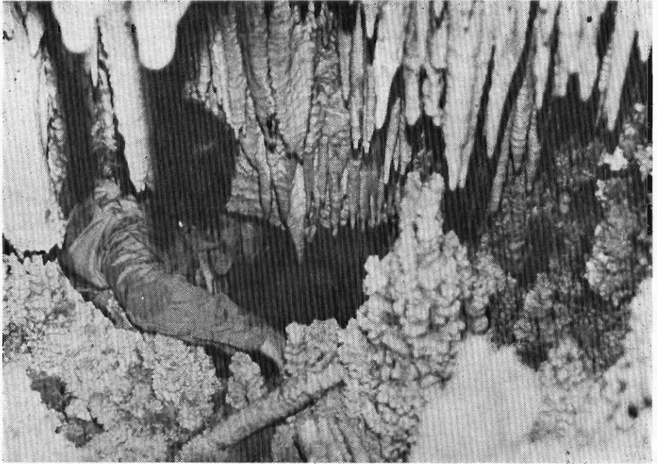
Εικ. 2. Ἡ ἐσοχή με τὸν πῖο πλούσιο διάκοσμο τόσο στὴν ὄροφή, ὅσο καὶ στὸ δάπεδο τοῦ σπηλαίου.