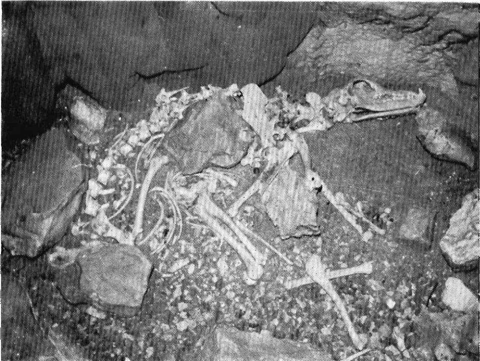
Εἰκ. 2 Ὄστᾶ ζῶων στὸν πρῶτο θάλαμο.

Ἡ ἐξερεύνηση πραγματοποιήθηκε τὸ Σεπτέμβριο τοῦ 1977 ἀπὸ τὰ μέλη τῆς Ε. Σ. Ε. κ. κ. Θεόδωρο Κιτσέλη καὶ Γεώργιο Μοσχονᾶ, μὲ ὑπεύθυνο τὸν γράφοντα. Στὴν ἐξερεύνηση ἔλαβε μέρος καὶ ὁ καταγόμενος ἀπὸ τὴν Ἀλέα ἑλληνοαμερικανὸς κ. Βασ. Ταμπούρης (Βλ. εἰκ. 1).