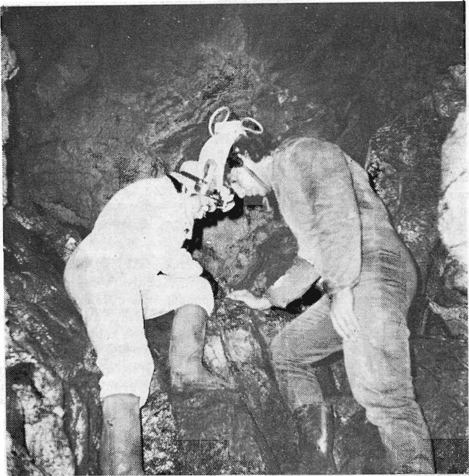
Είκ. 3. Σπήλαιο «Ἡ Παναγιά τοῦ βράχου» Χρούσας Μεγαλοπόλεως. Ἀπότομοι βράχοι ὀδηγοῦν στὸν τελευταῖο θάλαμο.

σμούς, πὸν προκαλοῦν ἀξιόλογη ἐντύπωση. Ἐπίσης ἀξιόλογη ἐντύπωση παρουσιάζει ὁ τελευταῖος θάλαμος μὲ τὸν ἐξώστη του, πρὸς τὰ δεξιὰ, πὸν θυμίζει ἀπολιθωμένο καταρράκτη.