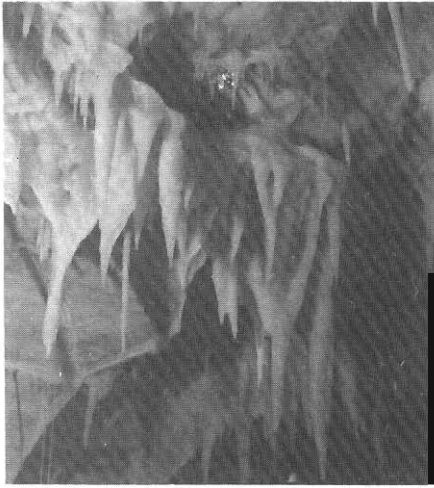
Σταλακτική διάκοσμος του σπηλαιίου «Δυρού».