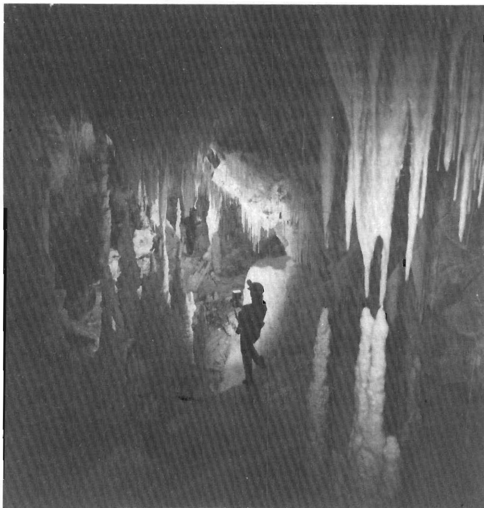
Σπήλαιο «Γλυφάδα» Δυρού. (Φωτ. Γ. Αβαγιανός).

εξαιρετικό σταλακτικό στολισμό και θαυμαστό εκτεταμένο πέτρινο καταρράκτη στην αρχή του δεξιού τοίχου της. Ο καταρράκτης ξεκινά από θάλαμο που διανοίγεται σε ύψος 10 μ. περίπου, με διαστάσεις 15 \times 15 \times 2 μ., με ανηφορικό δάπεδο και πλαισιώνεται από κολώνες. Ο πέτρινος καταρράκτης καταλήγει στη στάθμη των νερών της λίμνης και την απομονώνει, φαινομενικά, από τη συνέχεια της, γιατί τα νερά συνεχίζουν σε κενά διανοιγμένα κάτω από τα χερσοσία τμήματα που αναφέραμε και ενώνονται με τα νερά της «Διπλής λίμνης».