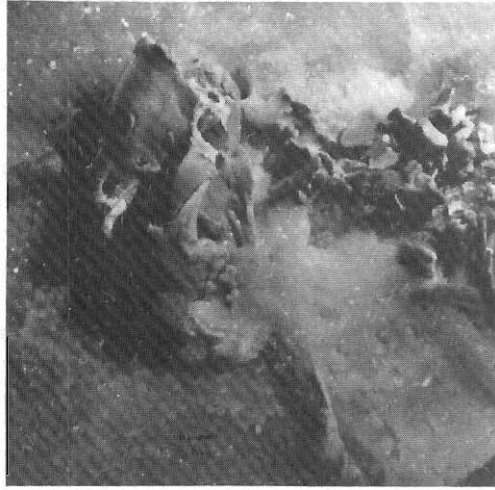
Το κεφάλι από τον απολιθωμένο σκελετό πάνθηρα που βρέθηκε από τους σπηλαιολόγους της Ε.Σ.Ε. στο σπήλαιο «Γλυφάδα Δυρού».

Δεξιά από τις συστάδες των στύλων διανοίγεται θάλαμος με μήκος 12 και πλάτος 6 μ. με στολισμένους τοίχους και δάπεδα.