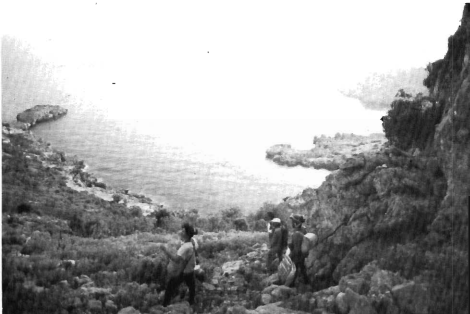
Κοιτάζοντας από την είσοδο της σπηλιάς προς την θάλασσα.