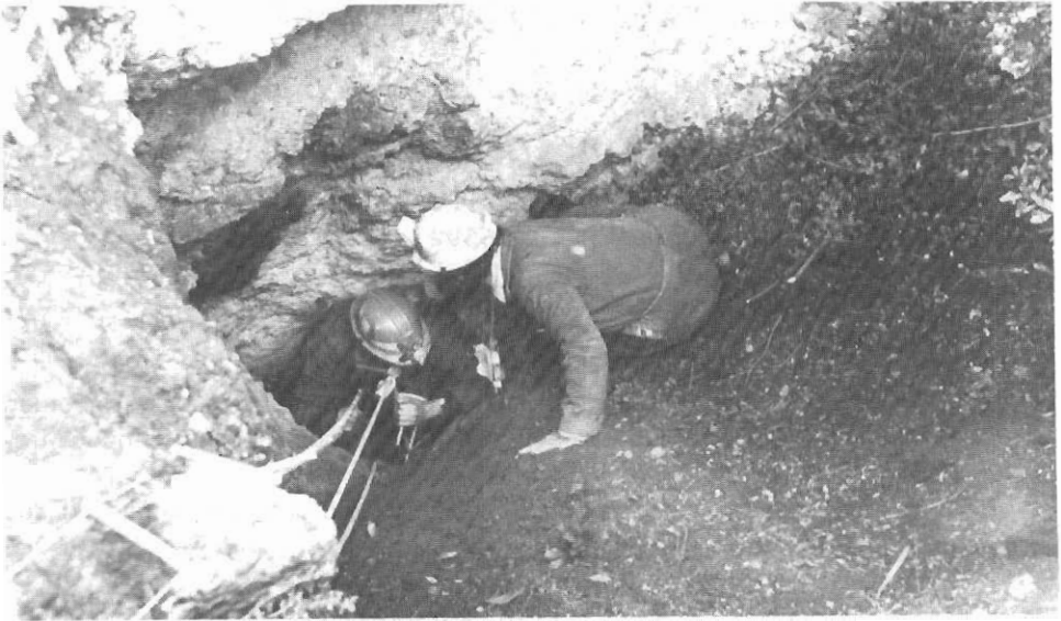
«Κουκουνάρα» Πύλου. Είσοδος του σπηλαίου.