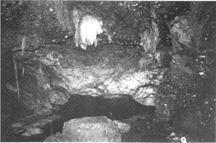
Η μικρή λίμνη.