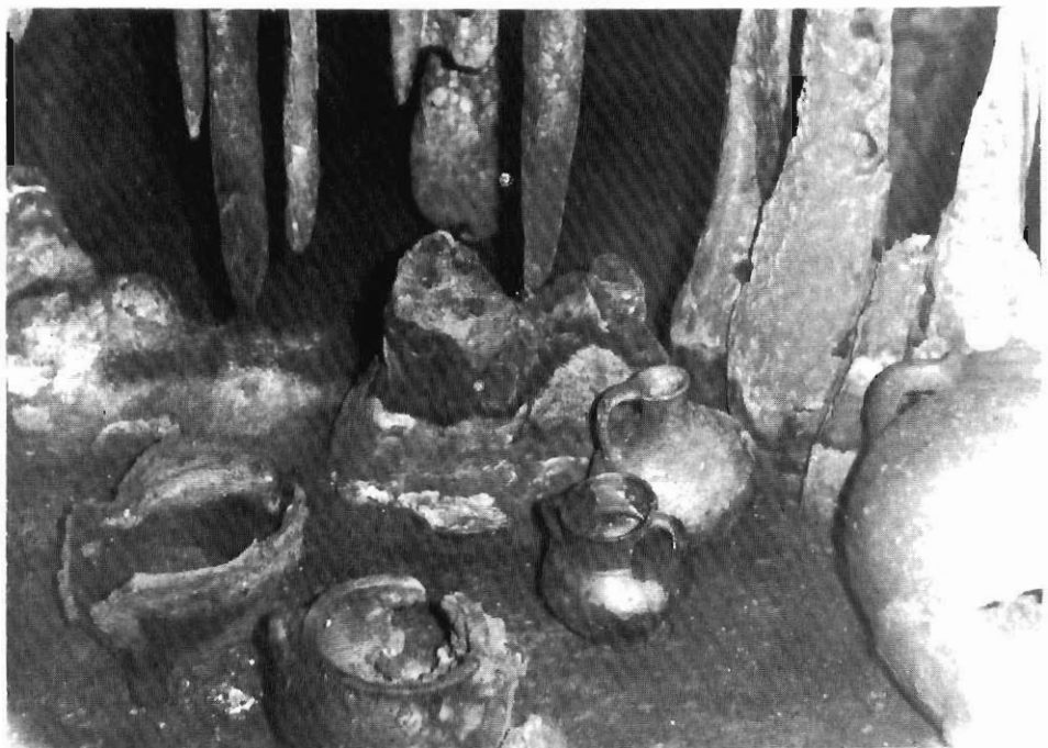
Αγγεία στο δάπεδο του σπηλαίου.

ύψος περίπου 10μ., αλλά με μήκος πολύ μεγαλύτερο, ως τα 70 περίπου μ. Στο τέρμα του υπάρχουν ίχνη φωτιάς.