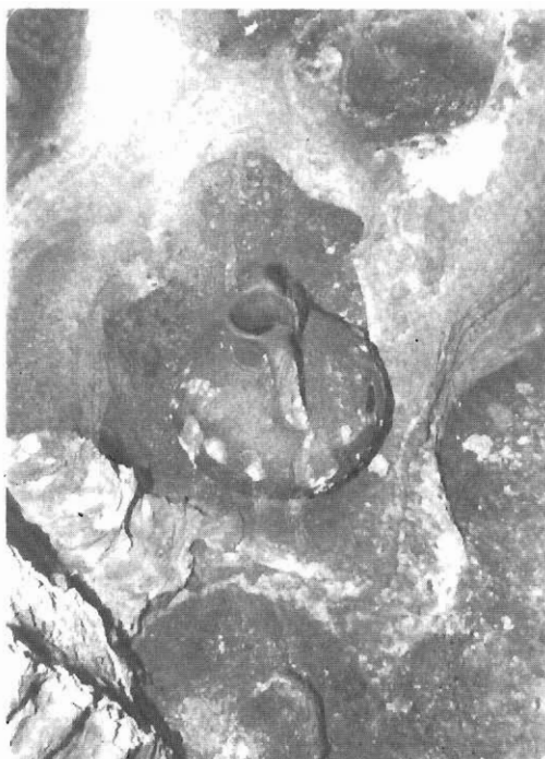
Αγγείο στο σπήλαιο Πρίνου.