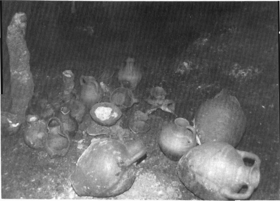
Αγγεία στο δάπεδο του σπηλαίου.

τος . Ο τελευταίος και μεγαλύτερος. Οι διαστάσεις του είναι περίπου 200 \times 1-10 \times 5-20 μ. ύψος. Από τις διαστάσεις του καταλαβαίνει κανείς ότι και τα στενότερά του μέρη είναι αρκετά ευκολοδιάβατα. Είναι δε το αναγραφόμενο εδώ μήκος του εκείνο μέχρι το οποίο εμείς εκινήθηκαμε. Το πρώτο μέρος του παρουσιαζόμενου τώρα μέχρι κοντά 100 μ. έχει άξονα από Δ προς Α. Στο χώρο αυτό και κυρίως στο μέσον του βρέθηκαν και τριποδικά (μινωικά) αγγεία. Αρκετά από τα αγγεία (αμφορείς) του χώρου αυτού περιείχαν εκτός από άλλα και σταλαγματικό υλικό. Άλλα μέχρι τη μέση και άλλα μέχρι το στόμιο περίπου. Μετά το χώρο αυτό, ο επιμήκης σφραγγώδης θάλαμος για τον οποίο μιλάμε κάμπτεται κατά ενενήντα περίπου μοίρες και προσανατολίζεται προς Β. Το τμήμα με τον προσανατολισμό προς Β είναι περίπου όσο και το προηγούμενο. Στο τέλος του βρέθηκε ολόκληρο εγχειρίδιο και κοντά του τρία (3) αγγεία. Από το σημείο που βρέθηκαν τα τριποδικά αγγεία και μέχρι το σημείο που βρέθηκε το εγχειρίδιο και λίγη ακόμη απόσταση ήταν εγκατασπαρμένα τα περισσότερα αγγεία, απ' όσα υπήρχαν στην επιφάνεια του δαπέδου του σπηλαίου. Ο χώρος αυτός, με τα πολλά αγγεία, και μέχρι κοντά στη θέση που βρέθηκε το εγχειρίδιο, έχει δάπεδο ανηφορικό.