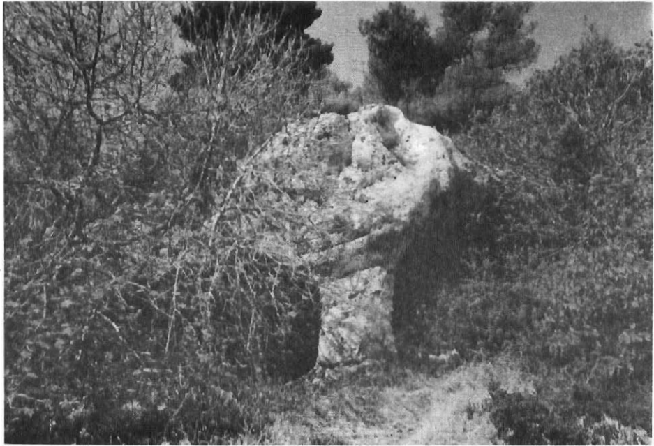
Η είσοδος του Σηλαιίου Βλαστού