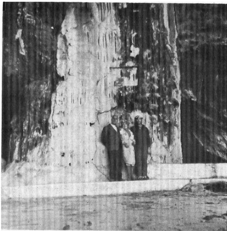
Είκ. 1. Τά μέλη τῆς ἀποστολῆς τῆς Ε. Σ. Ε. μπροστά στήν τεράστια κολόνα τοῦ «Προθάλαμου» τοῦ σπηλαίου Ἐντιπάρου.

τοῖχο του, ἀπό ὠραιότατες κολόνες καί σταλακτίτες πού μοιάζουν σάν καταρράκτες.