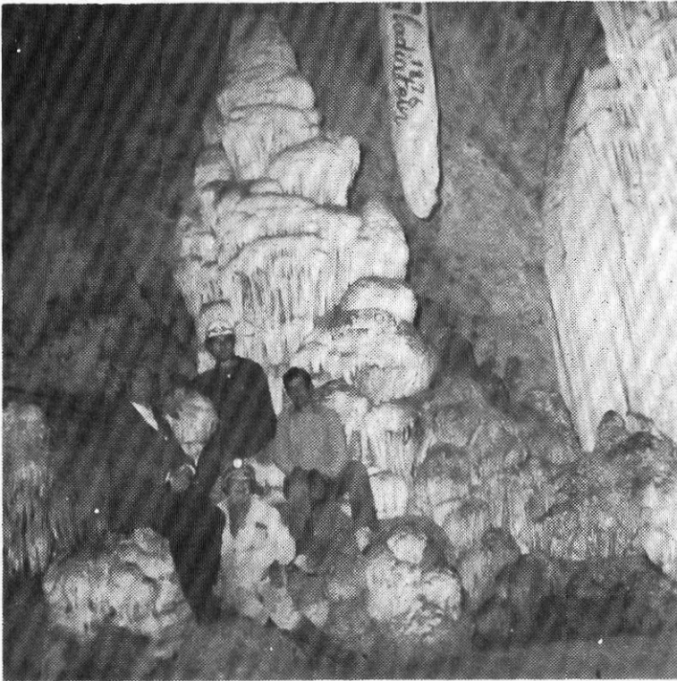
Εικ: 2. Τη βάση του σταλαγμίτη αυτού χρησιμοποίησε για Ἅγια Τράπεζα ὁ Νουαντέλ τὸ 1673, ὅπου ἔκανε λειτουργία. Σχετική ἐπιγραφή διακρίνεται στὸν σταλακτιτὴ πάνω.

γμίτες, πὸ ἓνας ἀπ' αὐτούς, ὁ χαμηλότερος, χρησιμοποιοῦντο γιὰ «Ἅγια Τράπεζα», γι' αὐτὸ πῆρε τ' ὄνομα «Καθεδρικός Ναός» (Εἰκ. 2).